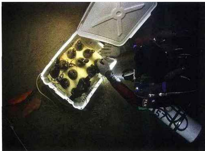
Au large des îles d'Åland, par 50 mètres de fond, les plongeurs ont découvert 70 bouteilles de "Juglar".